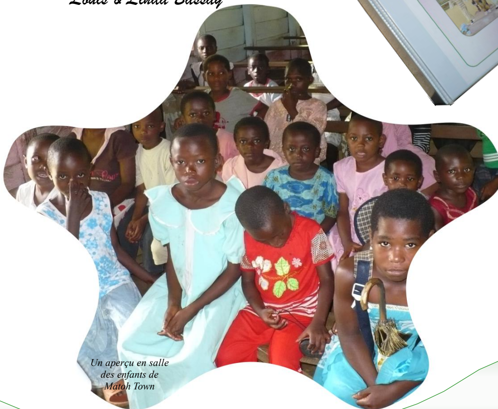
Un aperçu en salle des enfants de Matoh Town